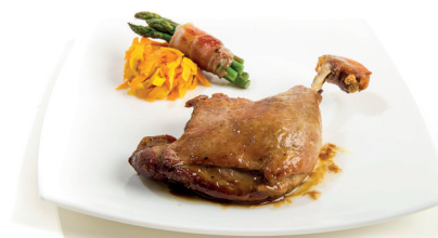
Muslo de pato en confit