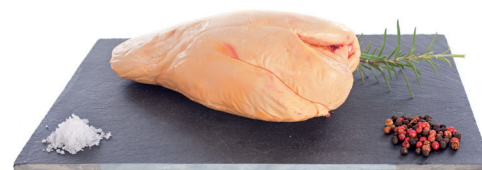
Foie de pato