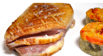
Magret de pato