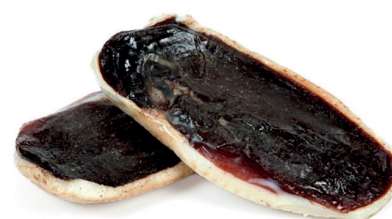
Jamón de pato entero curado